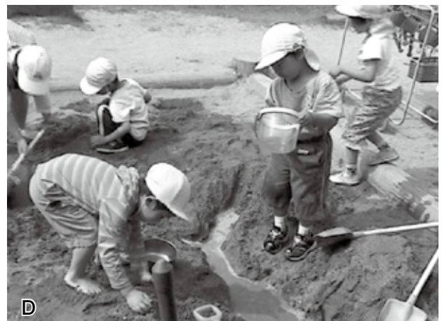
図1 幼稚園で観察された自然体験活動。A：虫とり，B：泥団子づくり，C：ウサギとのふれ合い，D：砂場遊び。