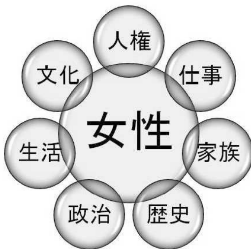
【図2】 戦後の初等社会科教科書と「女性」記述との かかわり】

前章までの考察を踏まえ、戦後の初等社会科教科書と「女性」記述との関わりを示したものが【図2】である。