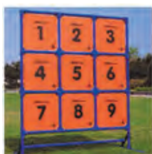
図6 ドッジビー・ディスク (直径235mm,65g) 図7 ストラックアウト数字板 (幅124×高さ140cm)