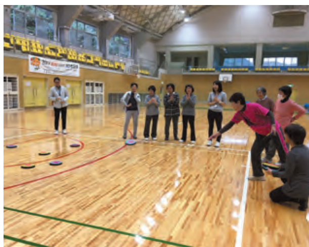
図9 ゲーム ディスクをエリアに投げる