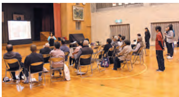
図4 講話 (H28.11.10)