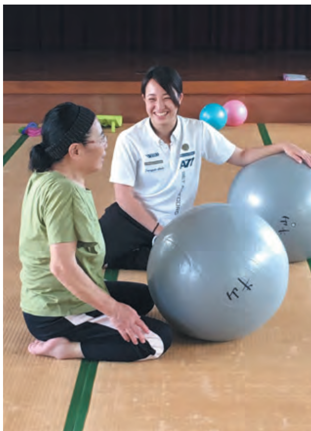
図3 個別指導とヒアリング

保健師と参加者との会話、ならびに参加者の生活習慣、歩行のスピード、動きのしなやかさの観察を通して参加者ができる最大公約数的運動を想定する。○足腰の状況を見て、できる運動の選定 ○運動の継続を期待できる運動の選定 ○自分のペースでできる運動 ○一緒に運動できる仲間づくりに繋がるグループ活