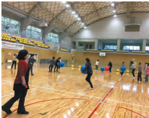
図8 ドリブル（移動しながら）

保健推進員が参加者であることから、高齢者への運動習慣への啓発と運動の方法について事前の情報共有を行った。