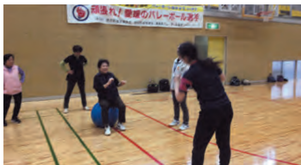
図5 バランスボールに乗って弾む