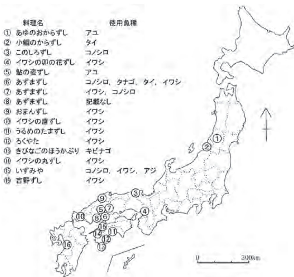
図1 『おから百珍』掲載の魚とおカラを寿司状に調理した郷土食の分布 (日本の伝統食を考える会(2010)により作成)