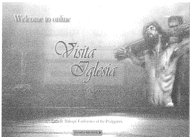
Figure 8: Online Visita Iglesia .

The third is the tension between the physical and virtual aspects of the pilgrimage. More recently, the Roman Catholic institution in the Philippines has sought to extend the practice of Visita Iglesia to those who cannot be physically present to do the pilgrimage (particularly to Overseas Filipino Workers around the world). It is now possible to practice the "Online Visita Iglesia ," whereby anyone with internet access can visit a website that shows live images of the Churches involved in Visita Iglesia (Figure 8). Through this online portal, 'virtual pilgrims' can also access online prayers, listen to hymns and view 360-degree images of Church interiors. This online experience is meant to replicate one's actual presence in the Visita Iglesia . There are some, however, who express some hesitation about this virtual experience. For many who perform the Visita Iglesia , the absence of the physical, bodily component of pilgrimage — such as walking, kneeling, praying, verbalizing — makes an online Visita Iglesia a relatively less meaningful experience of Christ's Passion. Moreover, the online Visita Iglesia cannot replicate the aura and ambiance of a church visit, thereby depriving the online pilgrim of an important facet of the pilgrimage.