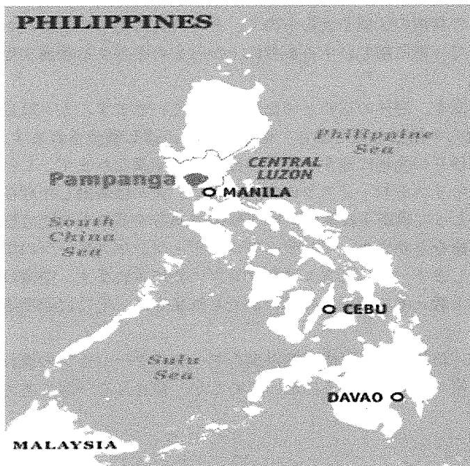
Figure 1: The Province of Pampanga, in Central Luzon, the Philippines

In this presentation, I will be focusing on the Visita Iglesia as it is practiced in the province of Pampanga, which is located about an hour drive north of the Philippine capital, Manila (Figure 1). First, I will describe the religious conditions in which the pilgrimage is practiced before commenting on the motivations that underlie its performance. I will then comment on the factors that have led to certain tensions that have changed the nature of the pilgrimage over time. In this way, I will also identify some broader social and cultural challenges that exert significant influence over its practice in modern times. It is my hope that my lecture will inspire a comparative discussion of pilgrimage traditions across the world, including that of the Shikoku Henro tradition in this part of Japan.