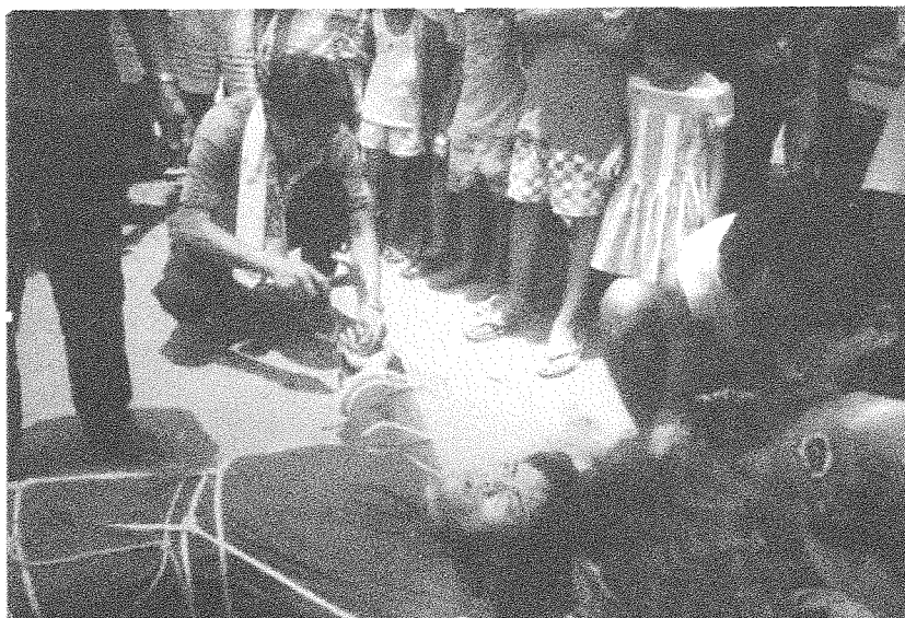
Figure 4: A penitent is nailed to the cross in Pampanga.

These rituals of popular piety demonstrate how the Passion is commemorated through the physical experience of bodily, ascetic suffering . While these rituals resemble the actual ordeal of Jesus Christ, this kind of ascetic suffering is not encouraged by Filipino religious authorities. In these rituals, Filipino Catholics themselves exceed their formal, sacramental obligations by using their own bodies as a way to commemorate their connection to Jesus Christ. I would like to show that this "excessive effort" — often a feature of popular piety — is also what characterizes the approach and performance of the pilgrimage tradition of Visita Iglesia.