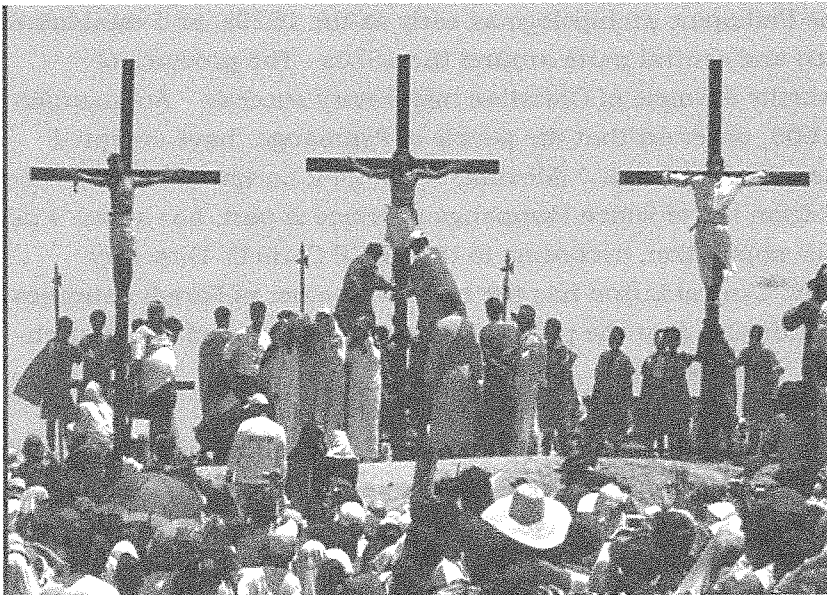
Figure 3: A Passion play is performed in Pampanga. Photograph by Stuart Clyne, 2006