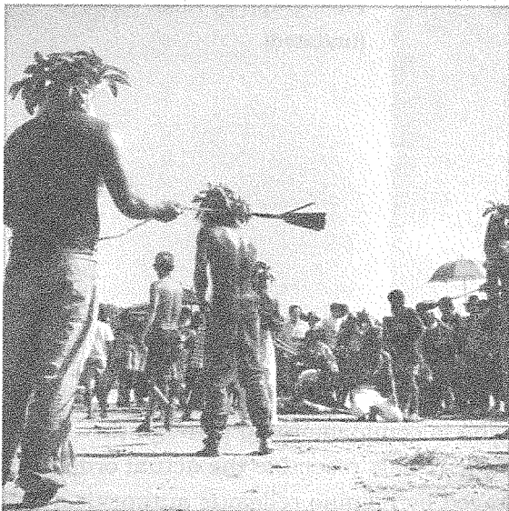
Figure 2: Flagellants whip themselves in Pampanga.

In the early part of Spanish missionization, Jesuit and Franciscan priests encouraged converts in Pampanga to conduct rituals of "self-mortification" — the act of applying ritual pain to the body — as a way of commemorating the significance of the Passion. Spanish colonial archives give us a sense of the range of religious practices of pain-infliction — collectively known as disciplina (or "discipline") — among the non-ordained population. These included acts such as self-flagellation (Figure 2), which were meant to inflict pain as a way to physically direct the mind and the body to God and to him alone.