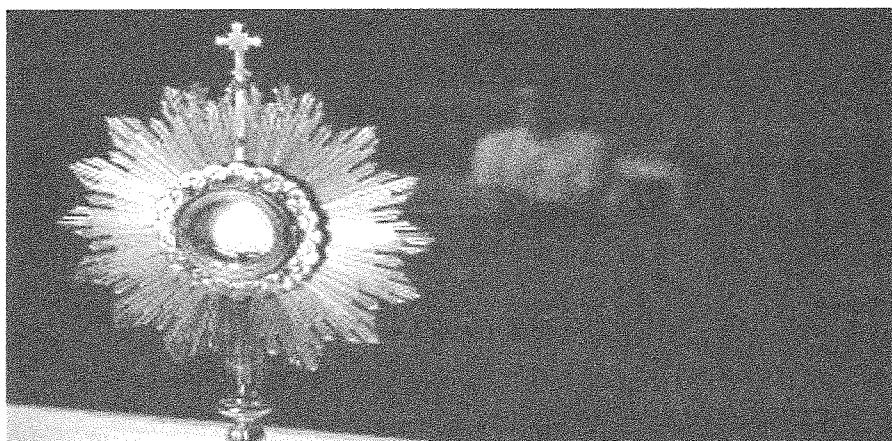
Figure 6: The Holy Eucharist is displayed to be "adored" during Holy Thursday.