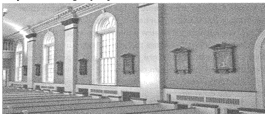
Figure 7: The Stations of the Cross are displayed in the walls of the Church

It is common for pilgrims to reflect on one or two images from the Stations of the Cross as they arrive in each Church. This effectively means that each Church represents the specific event that is depicted in the corresponding image. While the Eucharistic Adoration is a practice that calls for a silent and passive remembrance of the Passion, it might be said that the Stations of the Cross evokes the physicality of Christ's experience. As such, the Stations of the Cross correlates to a pilgrims ability to enact and embody the passion in ways that only physical exertion of the body can meaningfully capture.