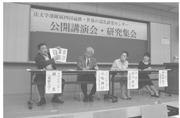
公開講演会シンポジウム（2016年10月29日）