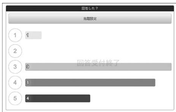
図2 Clica の回答提示画面

受講生側は五択の中から一つを選んで回答を送信するわけであるが、講師が「回答を締め切る」までは自分の回答を自由に変更が可能である。筆者は時間を見計らって回答を締め切り、回答の確認と集計をする。そしていくつかある結果提示法から棒グラフなどを随時選んで表示し、教室のスクリーンに授業用ノートパソコンからタブレット端末の画面を映すように切り替えて供覧した(図2)。なお、Clica にはコメントをテキストで入力する機能も標準的に備わっているが、今回はコメントを入力しないよう筆者が指示した。