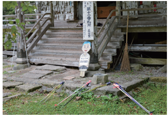
図6 四国の杖立 (a)石手寺本堂前、(b)浄土寺本堂前、(c)浄土寺手水前 (2022/10)