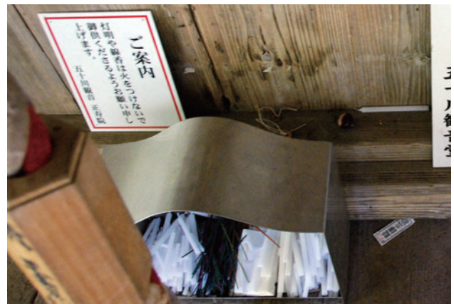
図4 置賜の火をつけない献灯・献香 (置賜31番五十川観音にて2019/10)