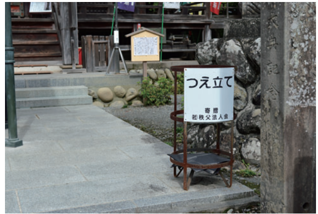
図7 秩父の杖立 (秩父1番四萬部寺にて2022/08)