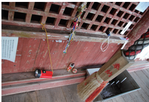
図5 置賜の懐中電灯 格子の左右2基の 懐中電灯が紐で結ばれている (置賜17番芹沢観音にて2019/10)

御開帳中の本尊が良く見えるようにという札所側のホスピタリティの表れであるが、それを巡礼者自身が操作するというのが面白い。