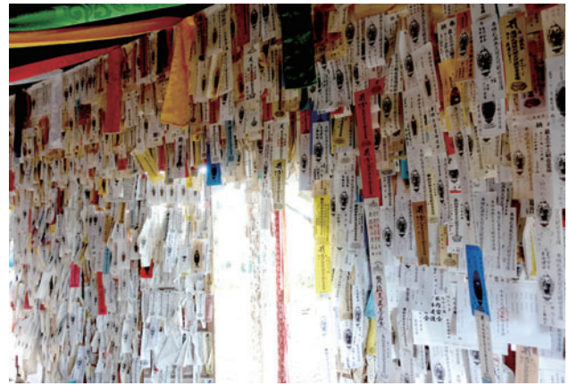
図3 最上の「おふだぶち」 (最上30番丹生観音にて2022/10筆者撮影)

置賜では謎かけのような光景に出会った。ひとつは未使用のまま奉納されたろうそくと線香である(図4)。置賜の公式サイトには「線香台や灯明台のない観音堂では火をつけずにお供えください」という但し書きがある (8) 。献灯と献香は文字通り「灯」と「香」を献ずる行為であり、その手段として一般的なのがろうそくと線香である。ろうそくと線香は着火することで、献ずべき光と香を発するが、ここでは点火せずに「見立て」によって光と香を献ずるかたちになっている。無人の札所や有人であっても観音堂と朱印所等が離れているため管理が難しい場合に火災防止の観点からこのような措置がとられて